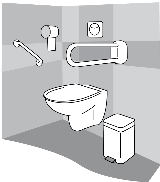
Fig. 5.13 – Exemple de WC

Il faut en effet que l'accès à la cuvette soit possible par accès latéral (un espace de 1,40 m x 1,40 m est alors nécessaire), ou par accès frontal (espace de 1 m x 2 m), suivant la nature du handicap. Il faut toujours que le fauteuil puisse se placer en proximité immédiate de la cuvette. L'accès sera rendu possible par des barres de soutien qui seront fixes si la cuvette est placée près d'un mur, relevables dans l'autre cas. En général, les barres seront disposées de manière que la personne puisse se tirer en se levant.