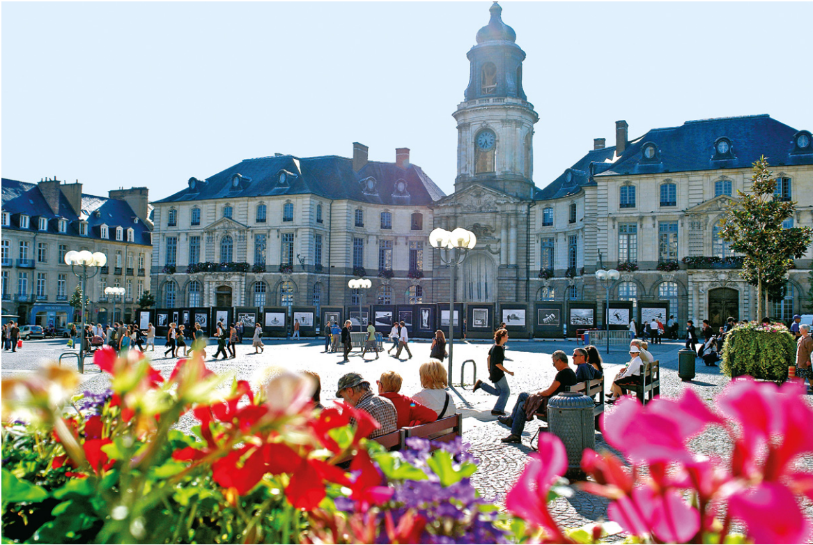
La place de l'hôtel de ville, classique, est le cœur de Rennes.