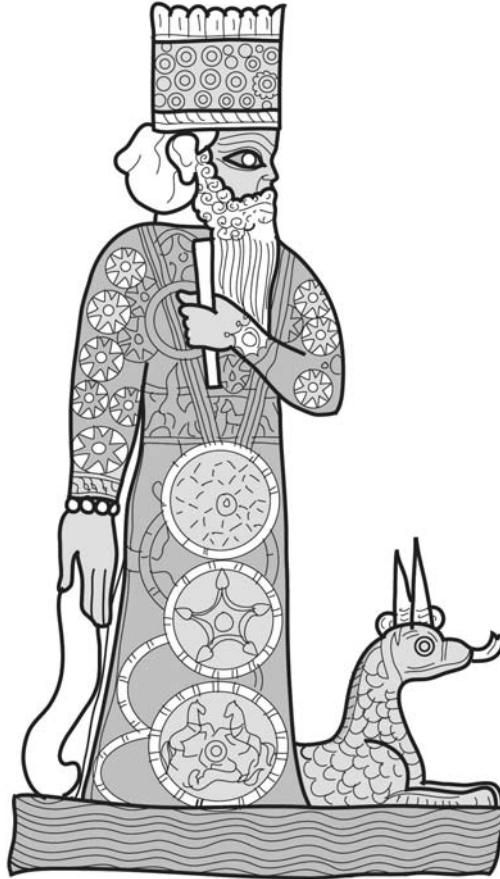
Marduk, dieu de Babylone.

Marduk agace Tiamat en s’amusant avec les quatre vents, un « cadeau » offert par son père. À son tour, Tiamat veut se débarrasser des dieux et de Marduk. Elle fait appel à Kingu pour les tuer et lui remet la tablette des destins. Elle crée une armée de créatures monstrueuses, hommes scorpions, monstres marins, lions géants, etc. et les envoie au combat. An va quérir Anu et Ea pour combattre les créatures de Tiamat, mais aucun n’ose s’aventurer. Seul Marduk accepte de se rendre au combat, à la condition toutefois qu’on lui transfère le pouvoir de fixer les destins, et voici Marduk partant à l’assaut aidé des vents et de la tempête. Il déploie un immense filet et attrape les monstres ainsi que Tiamat. Marduk tue Kingu, lui reprend la tablette aux destins et fait souffler les vents dans la bouche de Tiamat : une fois son ventre gonflé comme une outre, il tire une flèche qui la transperce.