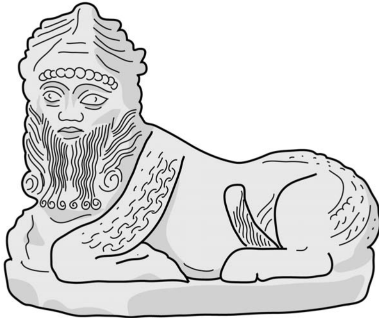
Taureau androcéphale d'Assyrie, symbole de puissance.

Symbole de puissance. Le dieu de la lune d'Ur est assimilé à un taureau céleste. En Assyrie, des taureaux androcéphales font office de gardiens et de protecteurs des portes des villes. Ils ont un corps de taureau, un visage humain et des ailes. Ils appartiennent à l'art assyrien du I er millénaire avant notre ère.