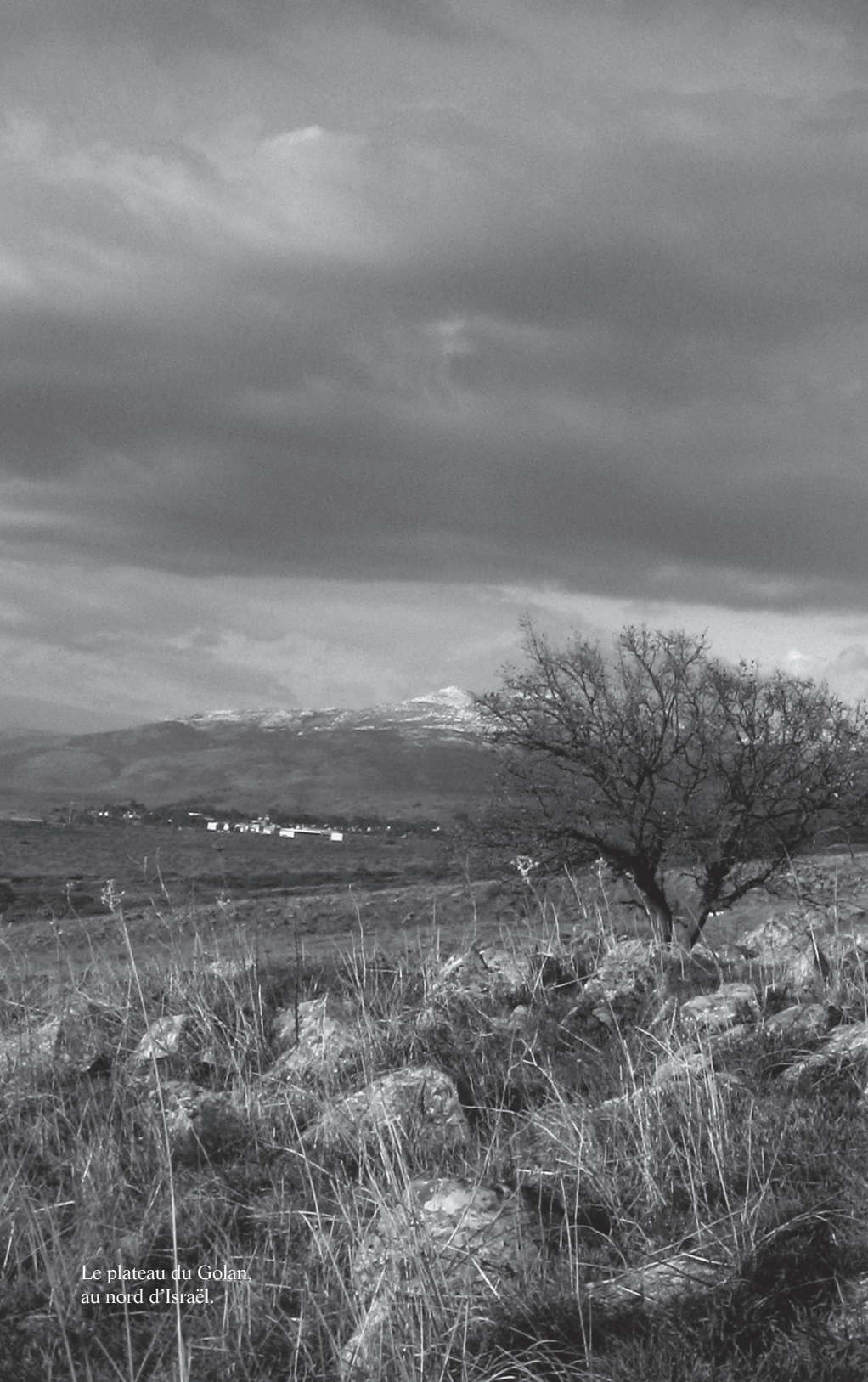
Le plateau du Golan, au nord d'Israël.