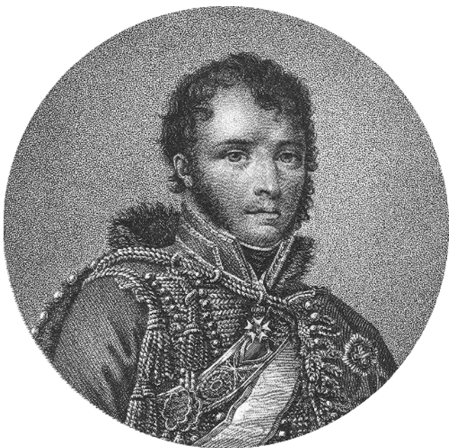
Charles Lallemand vers 1830.

de la Lorraine quelque chose de méridional, ou d'un peu bohémien.