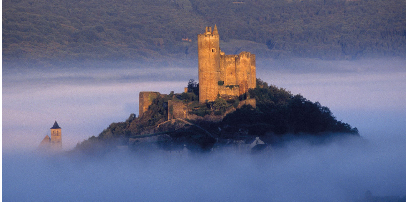
l'Îlot émergeant de la brume, Najac étire ses maisons aux toits de lauze au-dessus des gorges sauvages de l'Aveyron.