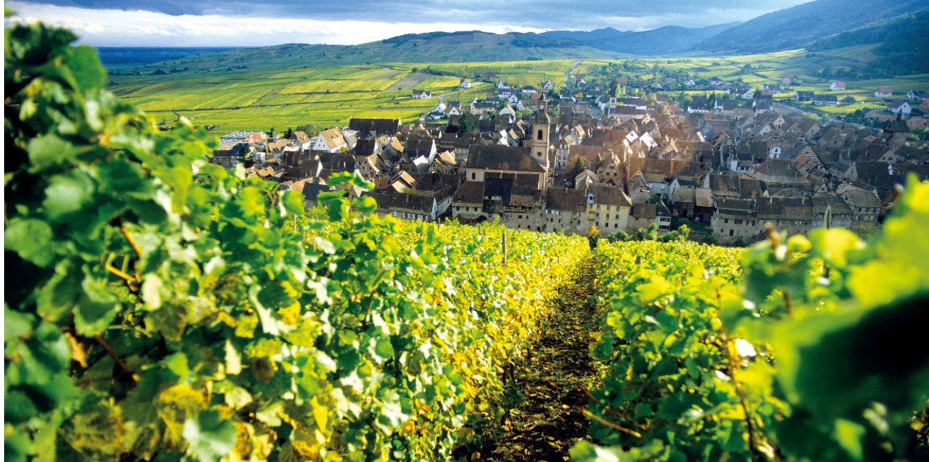
l Riquewihr et ses vignes, élégant village produisant l'un des meilleurs vins d'Alsace.