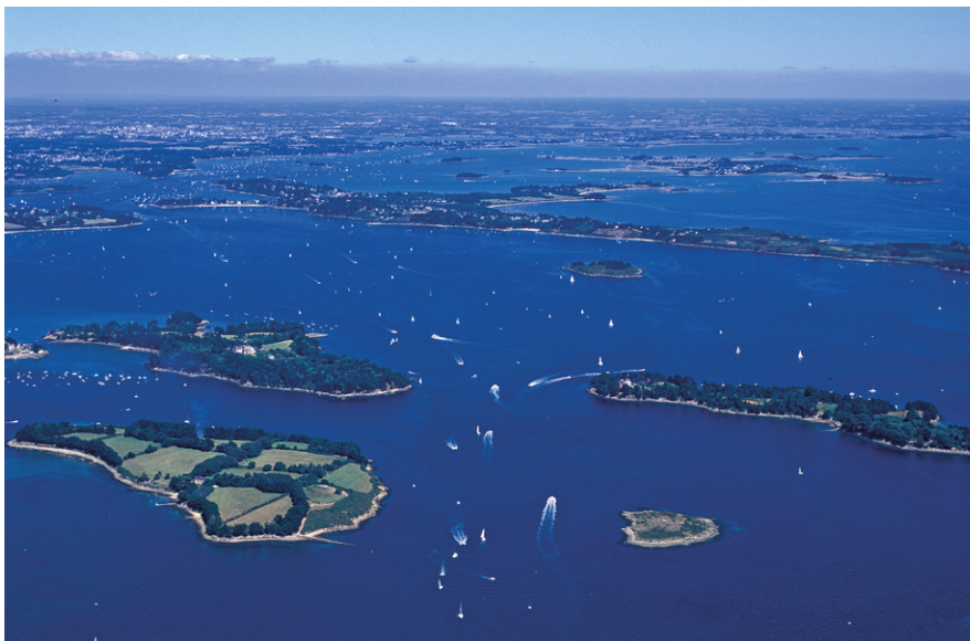
Vue panoramique du golfe, avec en son centre la croix de l'ancienne Craielis. Les sillages laissés par l'abondant trafic de voiliers semble correspondre aux dessins concentriques des îles.