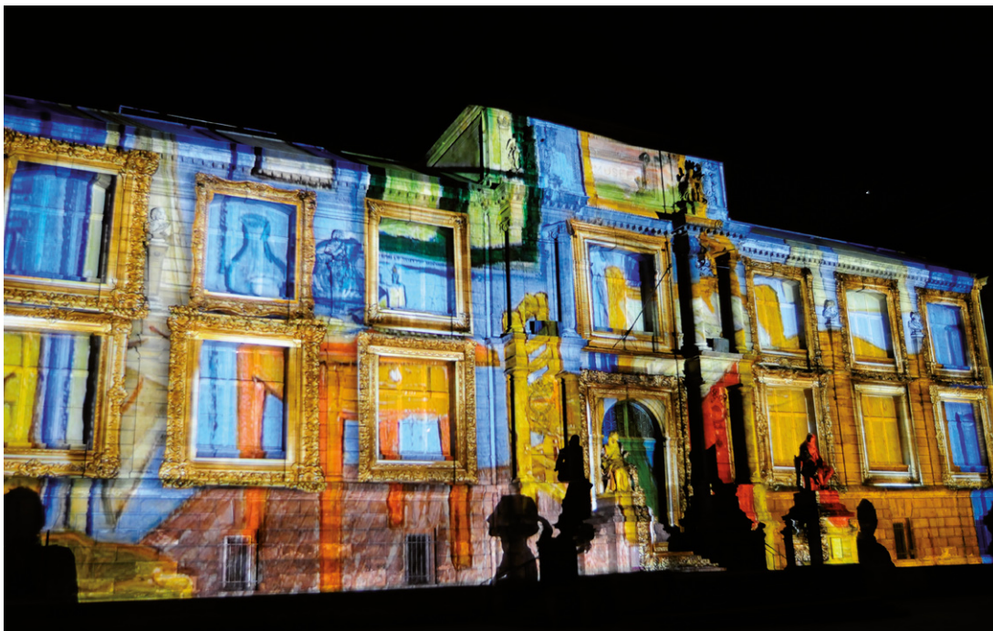
l Quand la nuit tombe sur la ville, le musée des Beaux-Arts renoue avec les couleurs de l'impressionnisme, avec cette mise en lumière très réussie réalisée par Skertzo.