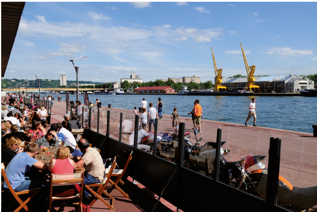
La Dolce vita à Rouen, où les quais réaménagés sont devenus de plaisants lieux de détente. Sur la rive gauche, l'arrivée du 106, salle dédiée aux musiques actuelles, crée un nouveau pôle d'animation au pied des grues Picasso.