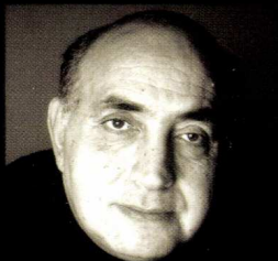
© Editions Flammarion / Pierre Ferbos

S'appuyant sur les thèses les plus récentes, Gilbert Sinoué plonge, à la manière d'une enquête policière, au cœur du mystère de l'une des figures les plus fascinantes de l'Égypte ancienne.