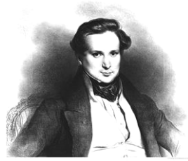
Victor Hugo jeune, par Devéria, 1829.

La vie et la carrière de ce fils de militaire (général de Napoléon I er ) furent un long combat. Avec un passage au théâtre fracassant : bataille à chaque montage, quelle qu'en soit l'issue, victoire ou désastre. Et toute la troupe romantique emboîte le pas au jeune poète à l'assaut de la Comédie-Française, génie avide d'argent et de gloire, rêvant d'unir en un seul grand public l'élite et le peuple.