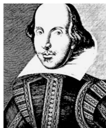
Gravure de Shakespeare.

Ainsi, impossible de savoir la part autobiographique de ses pièces, dont la paternité lui fut contestée. Et si Marlowe était l'auteur ? ou Francis Bacon (grand philosophe, histo-