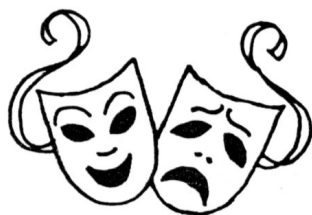
Masques de théâtre.

Paris ne peut pas vivre sans les Italiens. Quelques acteurs et tous les personnages de la commedia dell'arte vont se faire applaudir, dans les petits théâtres de la foire. Début de la « guerre comique » – et suite de cette storia dell'amore entre la France et l'Italie (voir page 26).