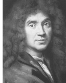
Portrait de Molière, par Mignard.

Particulièrement attachant, très français par son équilibre, proche de notre sensibilité et de ses personnages, il a travaillé et souffert pour son art, connu les échecs et la plus éclatante réussite, en une vie exemplaire, jusqu'à la fin.