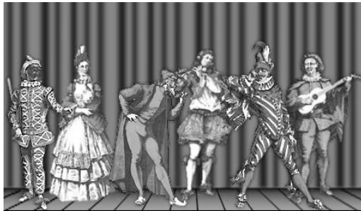
Personnages de la commedia dell'arte .

Née au milieu du XVI e siècle en Italie, la commedia dell'arte (« de métier » en français) donne au théâtre les premières troupes professionnelles : à la fois rentables pour les artistes et requérant un savoir-faire partout admiré. Atout supplémentaire : rôles féminins tenus par des femmes, habiles à faire rire comme à séduire et promptes à se dévêtir en scène, mais surveillées de près à la ville par les pères, frères et maris jaloux – les troupes sont très familiales.