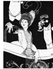
Opéra, loge humoristique.

Il se lance dans le drame avec sa première pièce à la Comédie-Française, EUGÉNIE, pour finir assez tristement avec LA MÈRE COUPABLE. Il tente l'opéra-comique avec LE BARBIER DE SÉVILLE (première version), refusé par la Comédie-Italienne. Et l'opéra, à l'Opéra de Paris, avec TARARE, musique de Salieri – petit succès.