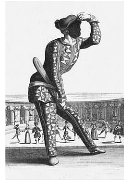
Arlequin de la commedia dell'arte .

Le succès s'explique. Le jeu vif et léger des Italiens donne corps au dialogue, leur vitalité scénique évite à cette « métaphysique du cœur » de n'être qu'un « marivaudage » d'idées et de sensibilités – piège pour tant de mises en scène à venir ! L'alchimie réussit d'autant mieux que l'auteur emprunte beaucoup à la commedia dell'arte : forme courte (1 ou 3 actes), personnages (Arlequin en tête), déguisement et travesti (jusqu'à l'invraisemblable), chassé-croisé entre maîtres et valets... et l'amour – l'Amour, comme premier ressort de la comédie. Voilà qui est nouveau sur nos scènes, et charmant.