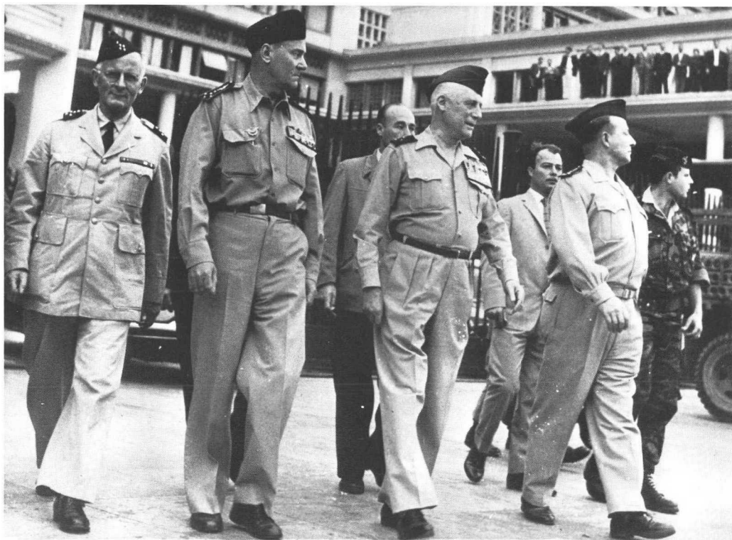
28 avril 1961 : (de gauche à droite) Les généraux Zeller, Jouhaud, Salan et Challe quittent la Délégation Générale au terme de l'insurrection, salués par la foule contenue par les paras.