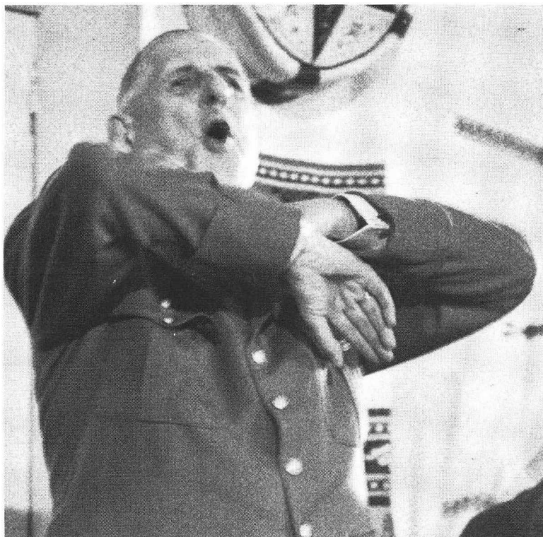
Dernier voyage de De Gaulle en Algérie. Discours de Tlemcen le 9 décembre 1960.