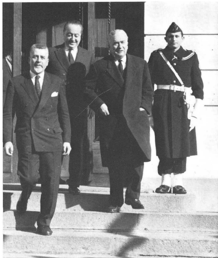
Mars 1962 : signature des accords d'Evian.