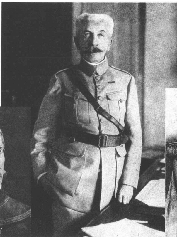
Le maréchal LYAUTEY (1854-1934)