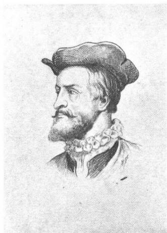
Jacques CARTIER (1491-1557)