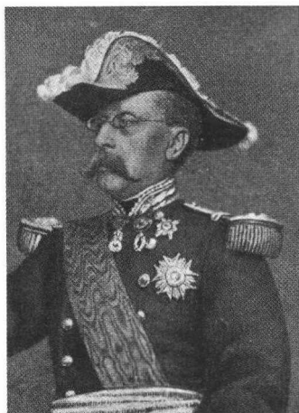
Général FAIDHERBE (1818-1889)