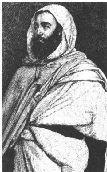
El Hadj ABD EL-KADER L'émir à Damas, l'ami de la France (1808-1883)