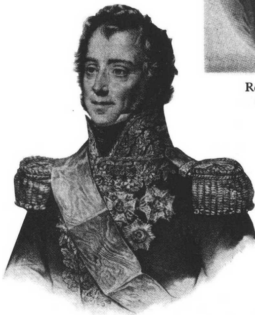
Le comte de BOURMONT (1773-1846)