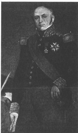
Le maréchal CLAUZEL (1772-1842)