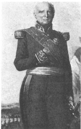
Le maréchal BUGEAUD (1784-1849)