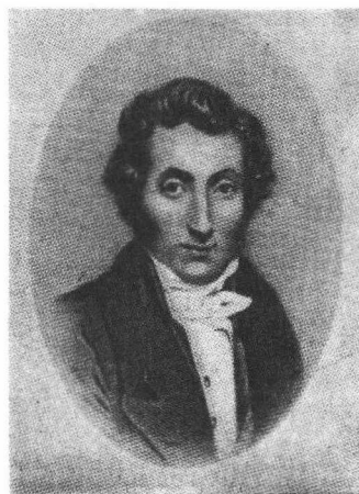
René CAILLIÉ (1799-1838)