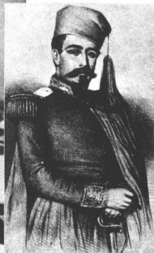
Le général de LAMORICIÈRE (1806-1865)