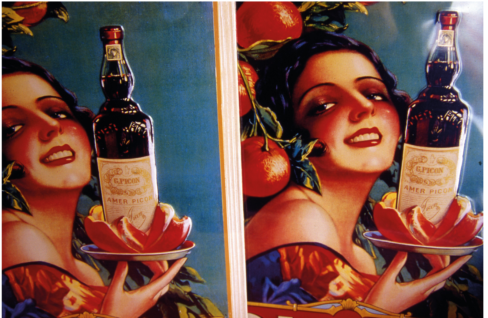
Le plaisir dédoublé, Saint-Ouen, marché Vernaison.