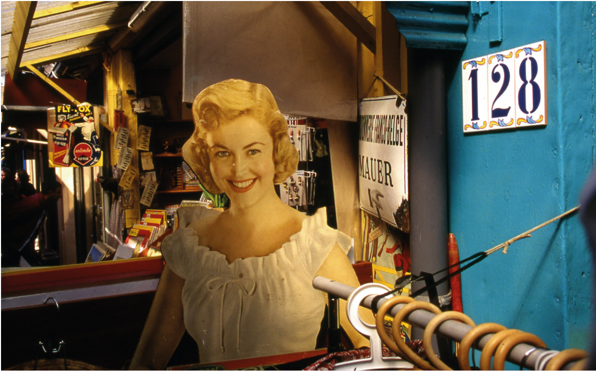
Un aimable accueil, Saint-Ouen, marché Vernaison.