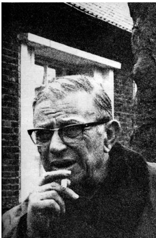
Sartre dans les corons du Nord, en 1970.