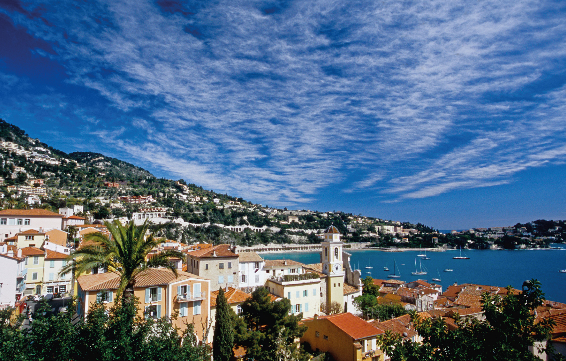
■ LA RADE de Villefranche-sur-Mer, avec sa plage de sable blond et sa végétation méridionale, réunit tous les ingrédients d'un bonheur paisible.