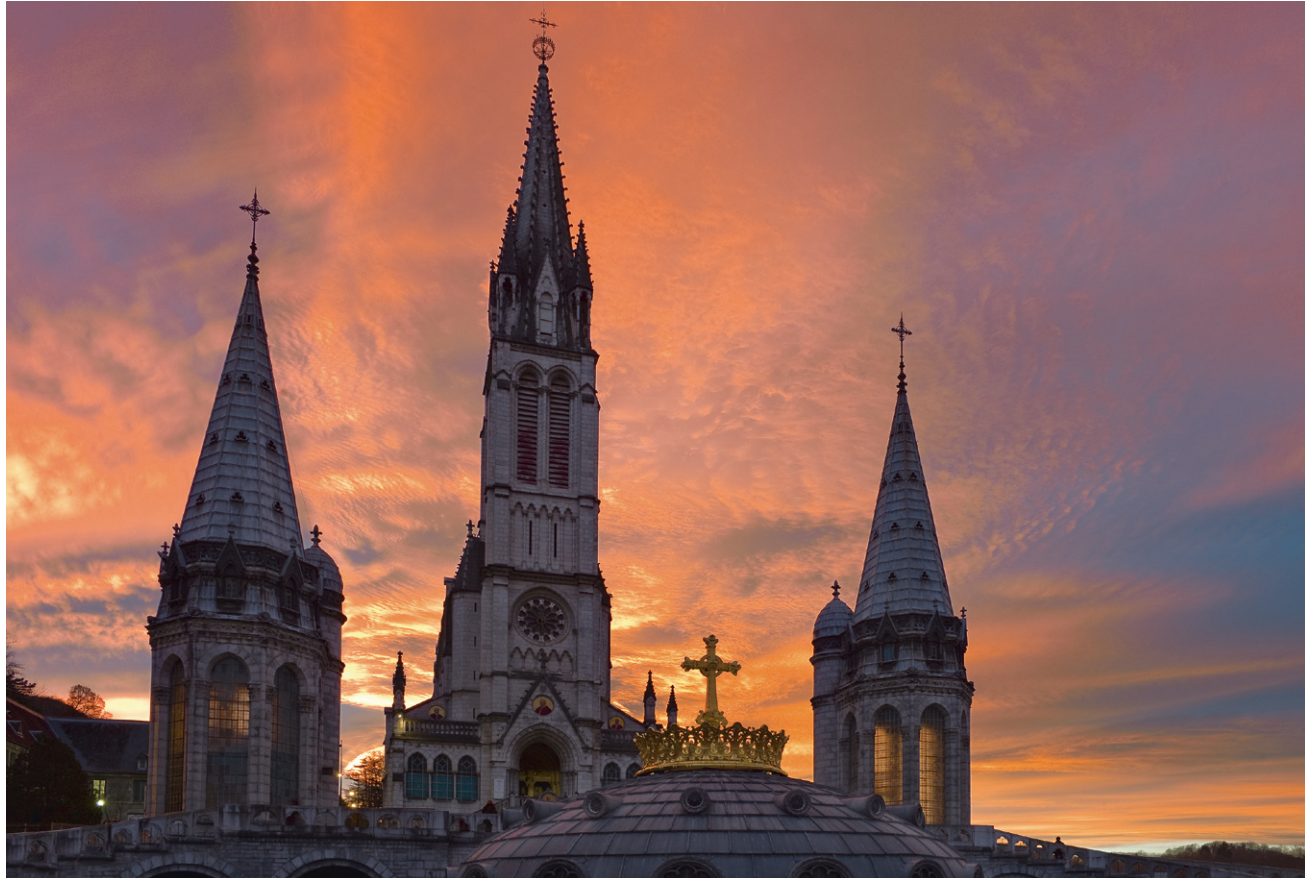
Les flèches élancées dans un ciel empli d'une lumière divine de la basilique de l'Immaculée-Conception de Lourdes.