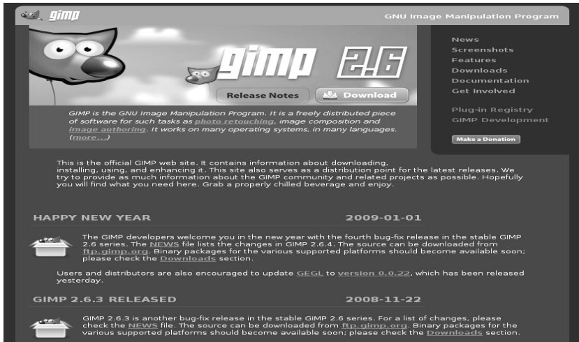
FIGURE B-5 Gimp, le site officiel

Des informations sont disponibles par fil RSS.