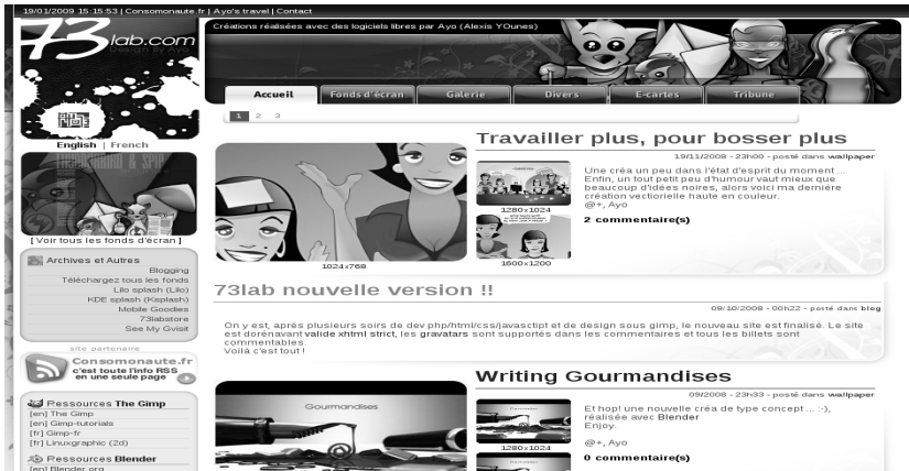
FIGURE B-4 Ayo

Alexis Younes, alias Ayo, auteur de l'illustration de couverture, explique sur son site comment il utilise Gimp, Blender et Inkscape.