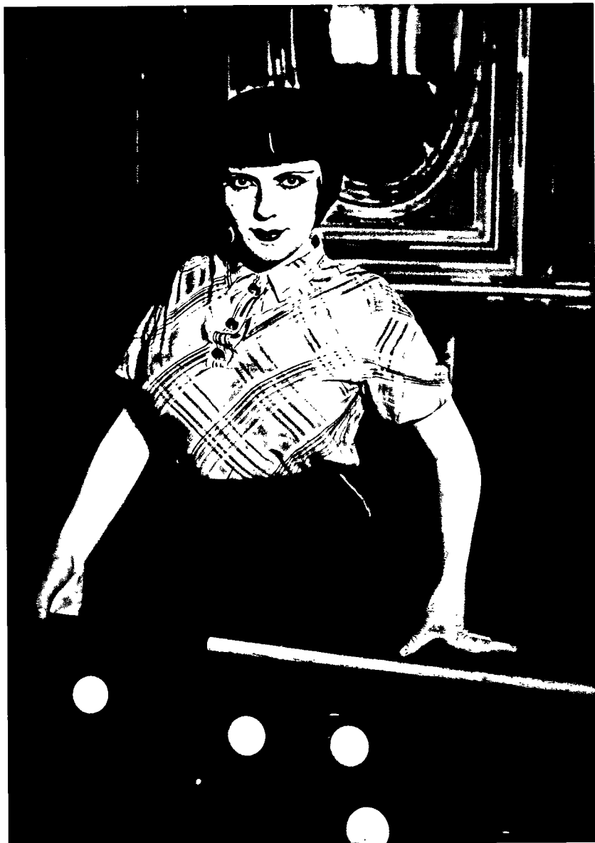
La fille au billard (1932).