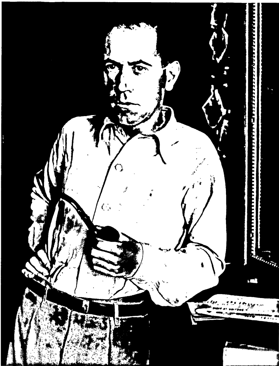
Alfredo Perles (1932).