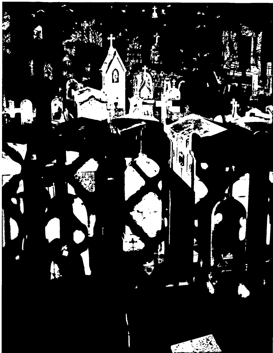
Le cimetière Montmartre (début des années 30).

« Le cimetière Montmartre, par exemple, pris la nuit du pont de Caulaincourt, est une création fantasmagorique de la mort s'épanouissant en gerbes électriques. De gros débris de nuit gisent sur les tombes et les croix, dans un fol enchevêtrement de poutrelles d'acier qui s'évanouissent avec le jour pour se fondre en magnifiques tapis de verdure, parterres de fleurs et allées en gravier. »