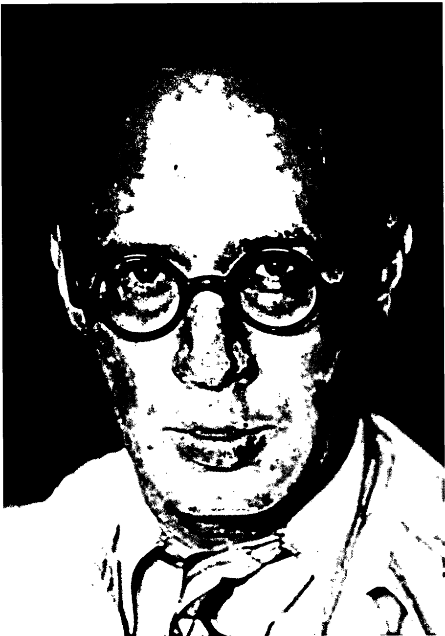
Henry Miller (1932).