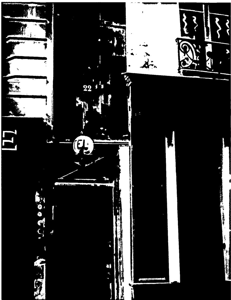
Hôtel de la montagne Sainte-Geneviève.