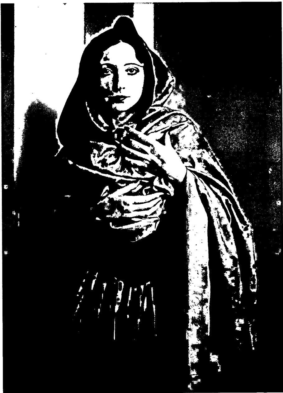
Anaïs Nin (1932).