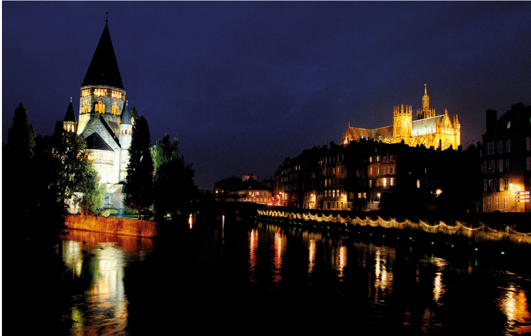
! Se reflétant sur l'eau, des siècles d'histoire mis en lumière.