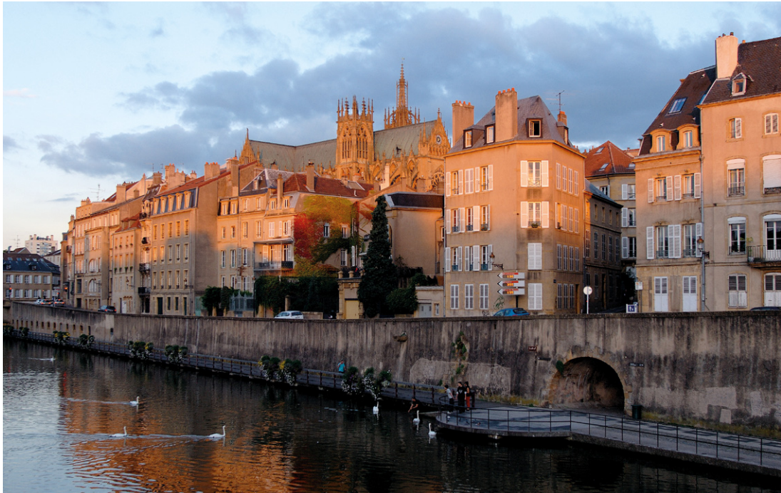
Metz, tout simplement...