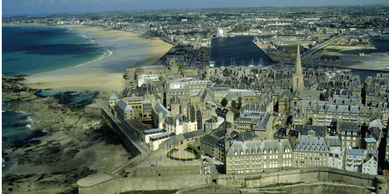
! Saint-Malo, une cité fièrement campée face à l'océan.