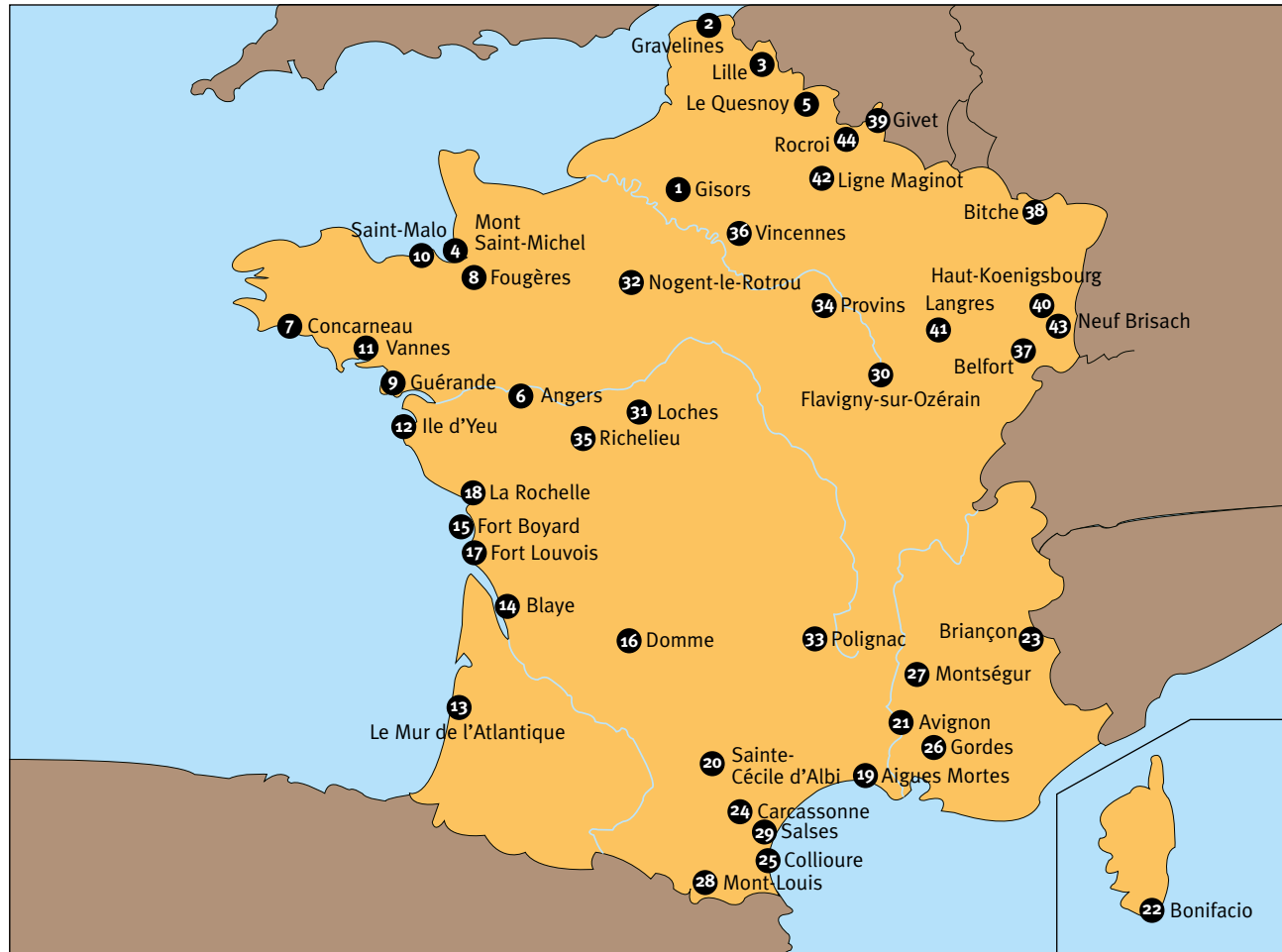
! Carte des sites fortifiés figurant dans l'ouvrage.