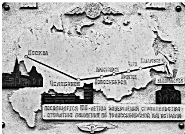
En gare de Vladivostok. Plaque de marbre avec le nom des principales villes reliées par le Transsibérien

synonyme de froid inhumain, de déportation, de goulag, de mort. Rien ne me permet alors d'imaginer l'explosion bouleversante du printemps sur ces terres dépeuplées.