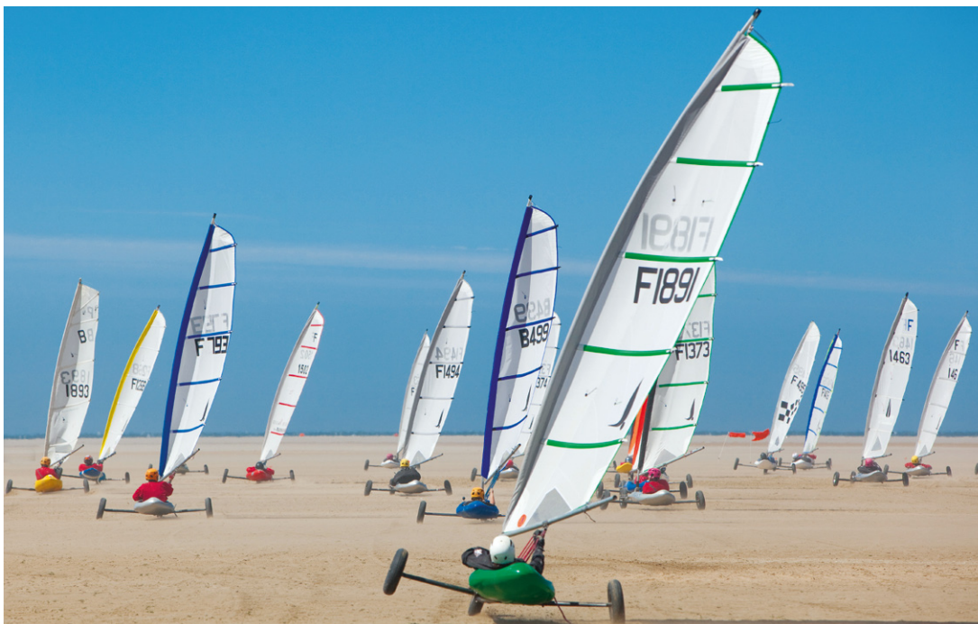
Le char à voile. Blériot, avant de traverser la Manche, inventa l'aéroplage. C'est devenu le sport le plus populaire de la Côte d'Opale, qui compte plusieurs champions européens et mondiaux.