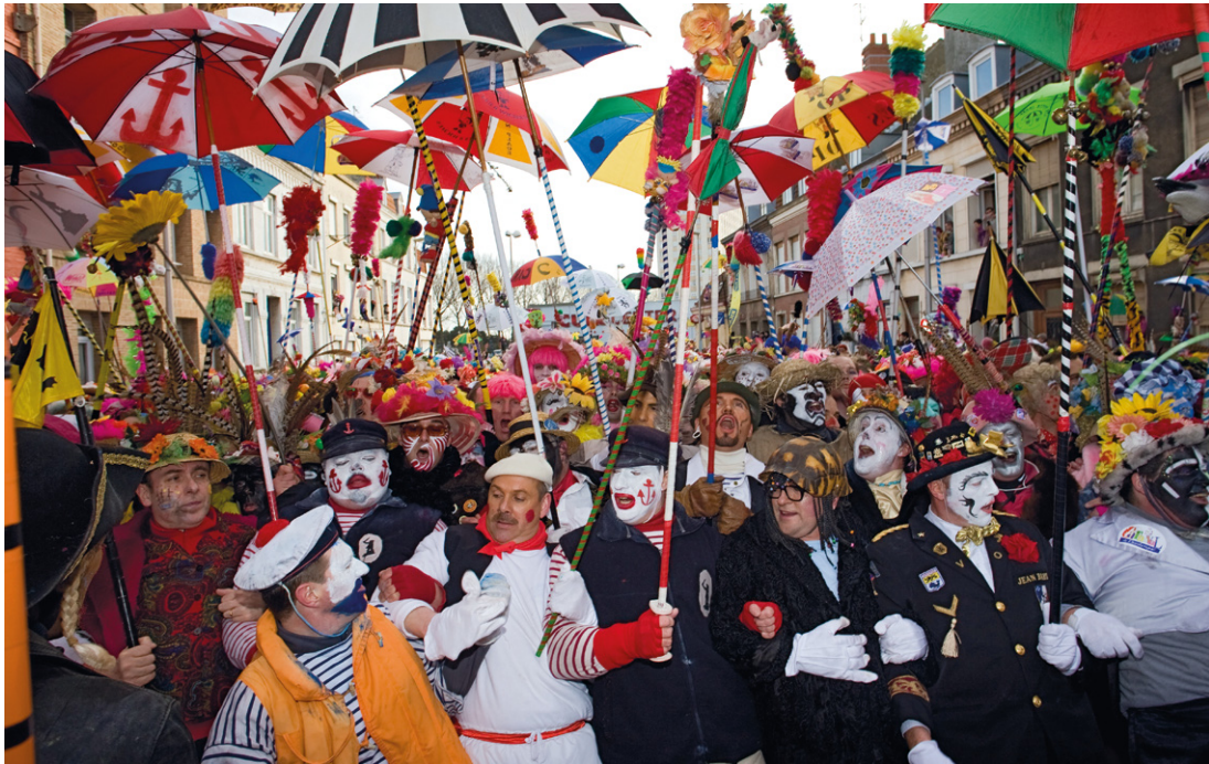
Le carnaval de Dunkerque. Le plus énorme, le plus populaire, le plus sympathique de France. Deux mois et demi de liesse à danser, à chanter et chahuter.