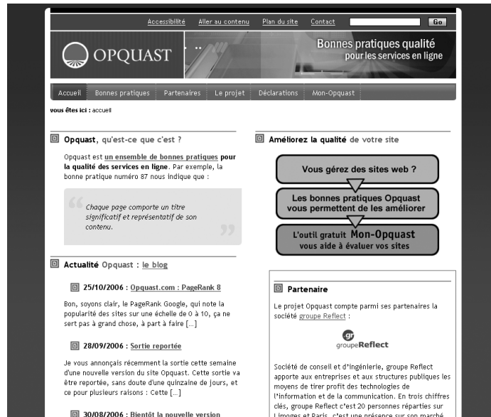
Figure C-3 Opquast.com