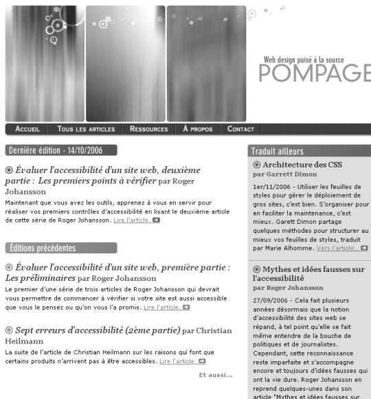
Figure C-4 Pompage.net