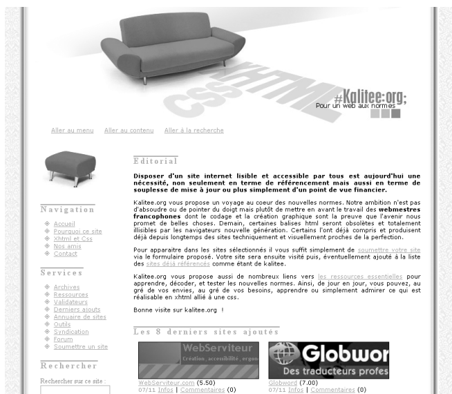
Figure C-7 kalitee.org