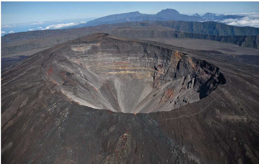
l'Apothéose de « l'île à grand spectacle », la Fournaise est l'un des volcans les plus actifs au monde. Il est âgé de plus de cinq cent mille ans !