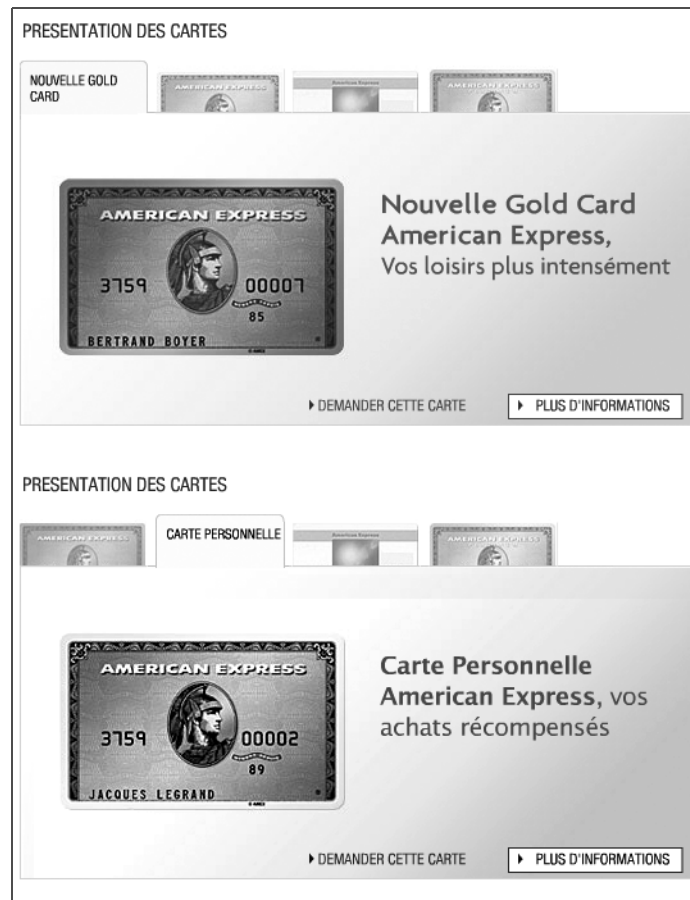
Figure 5-18 Sur le site d'American Express, un seul espace permet d'afficher quatre types de contenus. Les internautes peuvent naviguer parmi ces contenus en cliquant sur les onglets correspondants.

De même sur la page d'accueil du site American Express, où des informations clés sur 4 cartes de paiement sont disponibles par un simple clic dans le même espace.