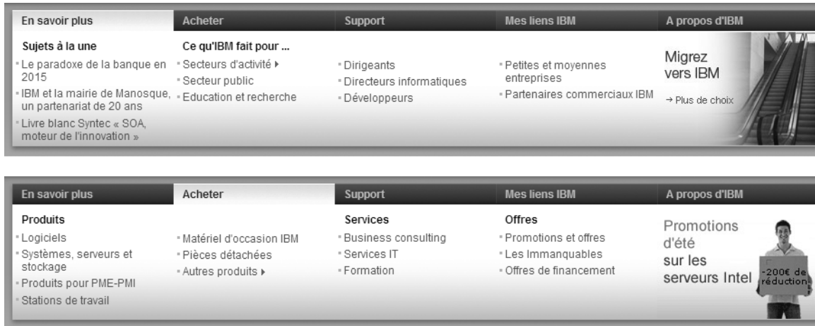
Figure 5-19 Sur le site d'IBM, un seul espace permet d'afficher cinq types de contenus. Les internautes peuvent naviguer parmi ces contenus en survolant les onglets correspondants.