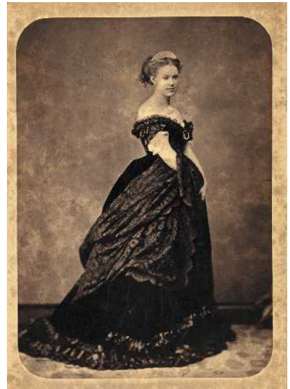
15. La duchesse de Castiglione-Colonna, plus connue sous son nom de sculpteur Marcello , aura avec Thiers, dont elle admire l'esprit, une longue amitié. « Ma chère duchesse ; je regarde avec plaisir, avec admiration, les brillantes et changeantes couleurs de votre plumage, n'ayant pas la moindre espérance de vous fixer auprès de moi. »