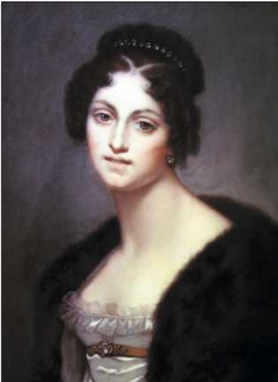
14. Dorothée de Courlande, duchesse de Dino, est la nièce de Talleyrand et la consolation de ses vieux jours. Elle collectionne les amants et entretient avec Thiers une tendre correspondance : « Vous me manquez trop ! »