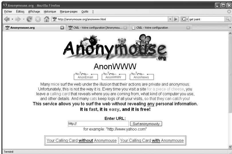
Figure 2.2 – Processus d'anonymisation du site anonymouse.org