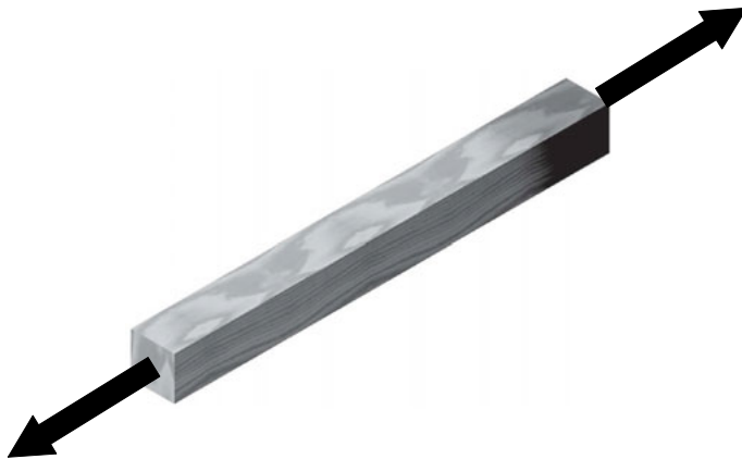
Schéma 1 : la traction axiale dans une barre est provoquée par deux forces de même direction et de sens opposé qui provoquent l'allongement des fibres