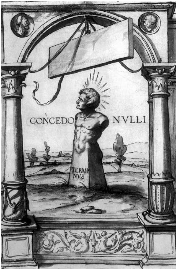
Hans Holbein le Jeune, Étude pour un vitrail avec Terminus , 1525.