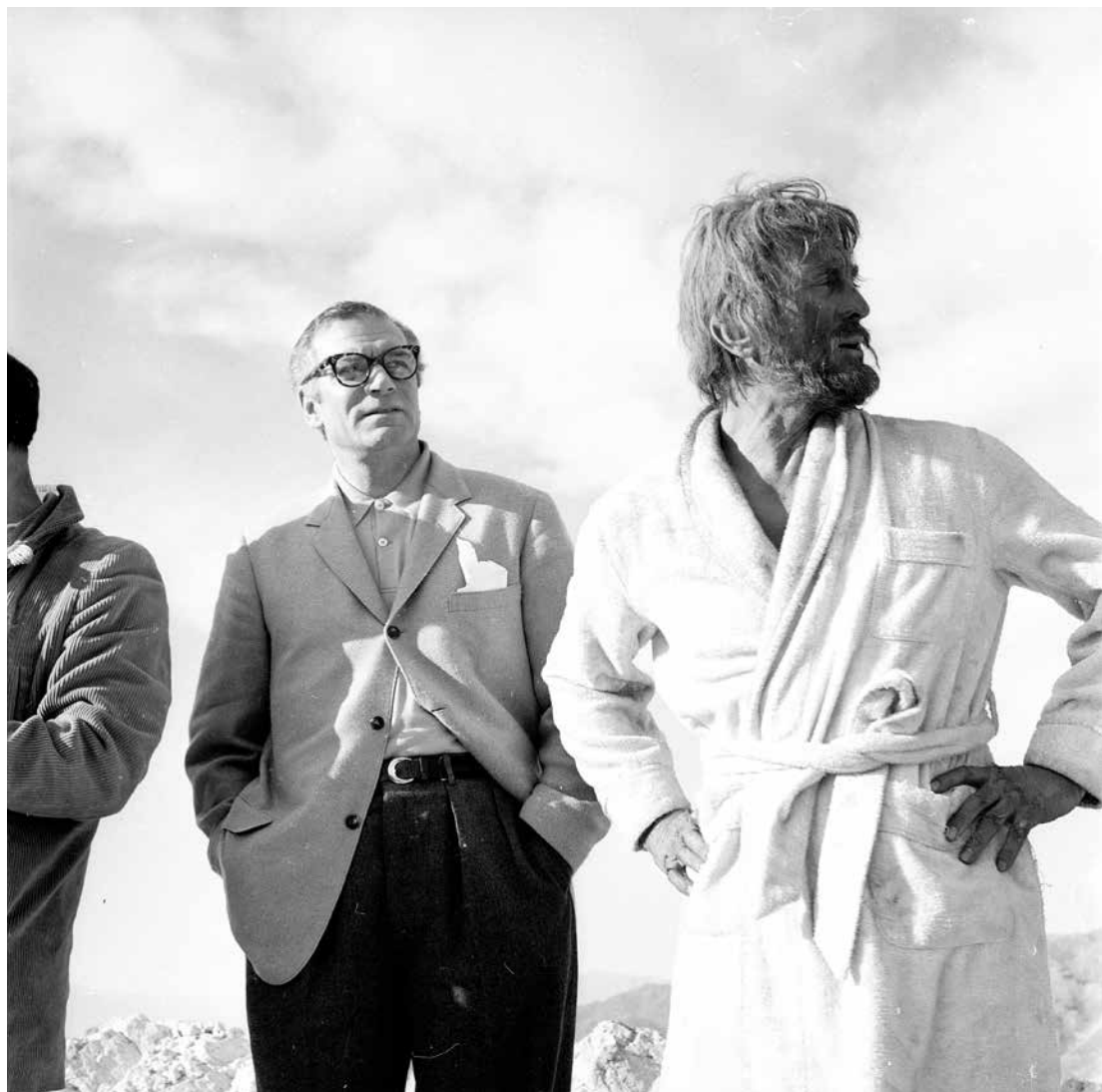
Premier jour de tournage: Laurence Olivier visite notre plateau en plein désert.