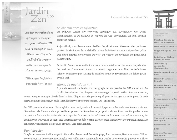
Figure C-7 CSS ZenGarden français