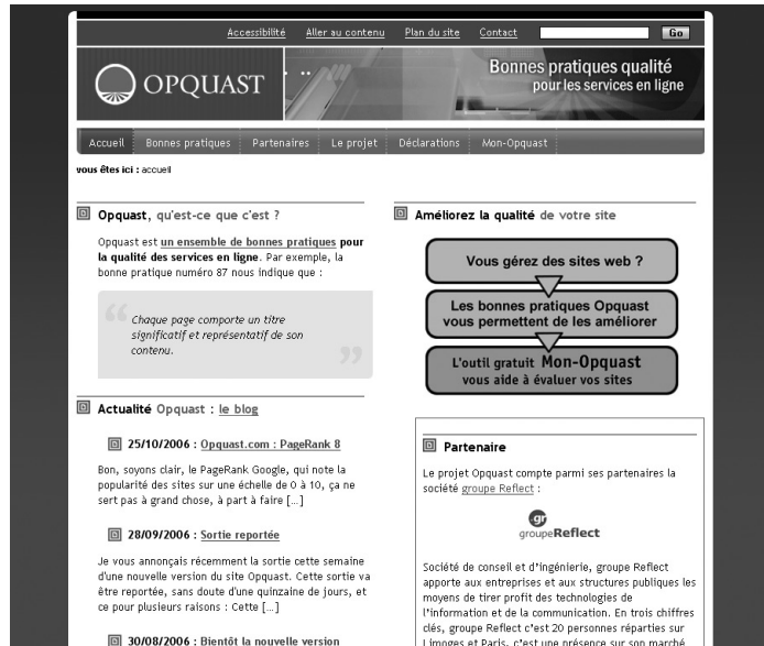
Figure C-3 Opquast.com