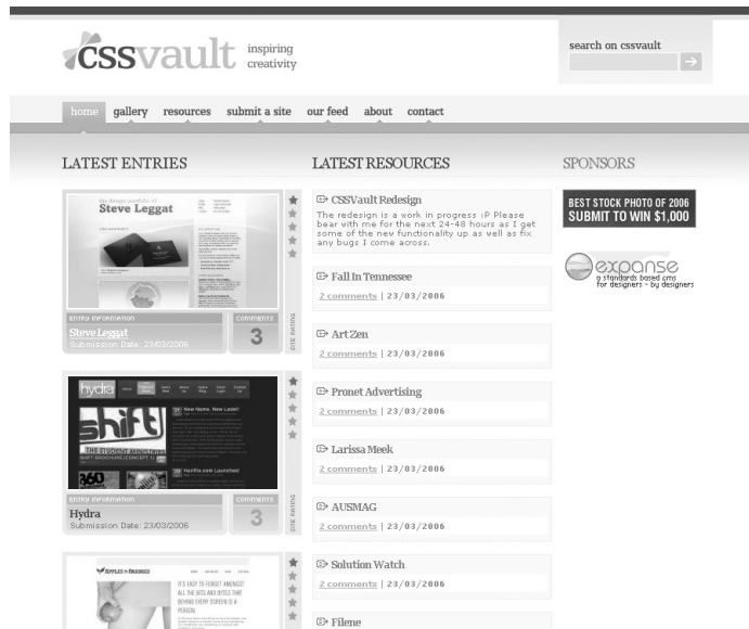
Figure C-8 CSS vault.com