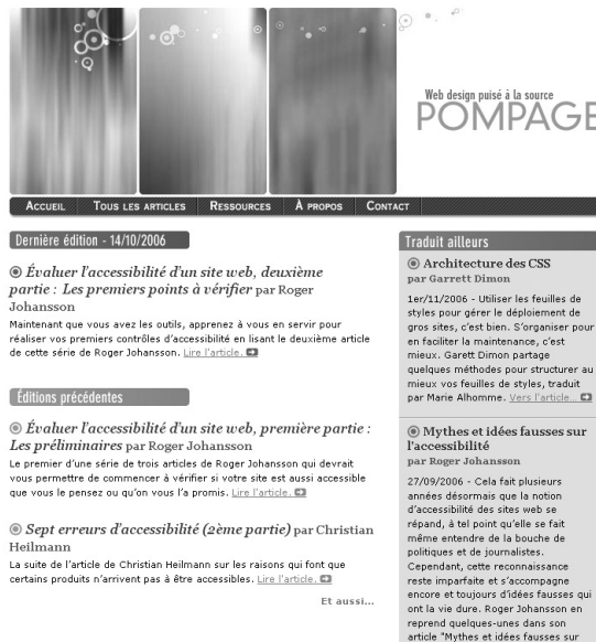
Figure C-4 Pompage.net