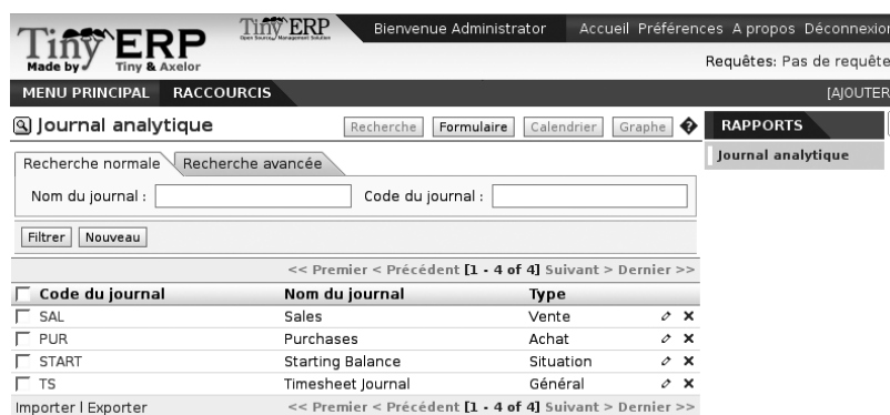
Figure 9-3 Création d'un journal analytique

Pour définir vos journaux analytiques, utilisez le menu suivant : Finance/Comptabilité>Configuration>Journaux>Journaux analytiques .