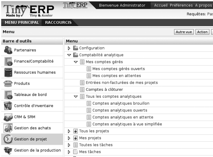
Figure 9–11 Comptabilité analytique dans la gestion de projets

Nous verrons dans les chapitres suivants comment chaque responsable de projet peut utiliser ces informations pour effectuer les différentes opérations de gestion : facturer automatiquement, planifier les projets, relancer les clients, budgétiser les ressources, etc.