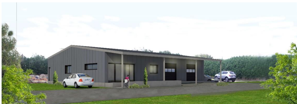
Projet de la future Brasserie sur Eygalières

Dans quelques semaines, nous allons démarrer la construction de notre brasserie sur la commune d'Eygalières au cœur des Alpilles. En attendant, nous louons un bâtiment à 7km de là sur la commune de Verquières.